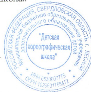
График образовательного процесса МБОУ ДОД «Детская хореографическая школа» на 2014 – 2015 учебный год